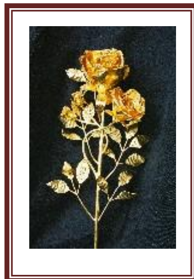
La Rose d'Or de la Chrétienté