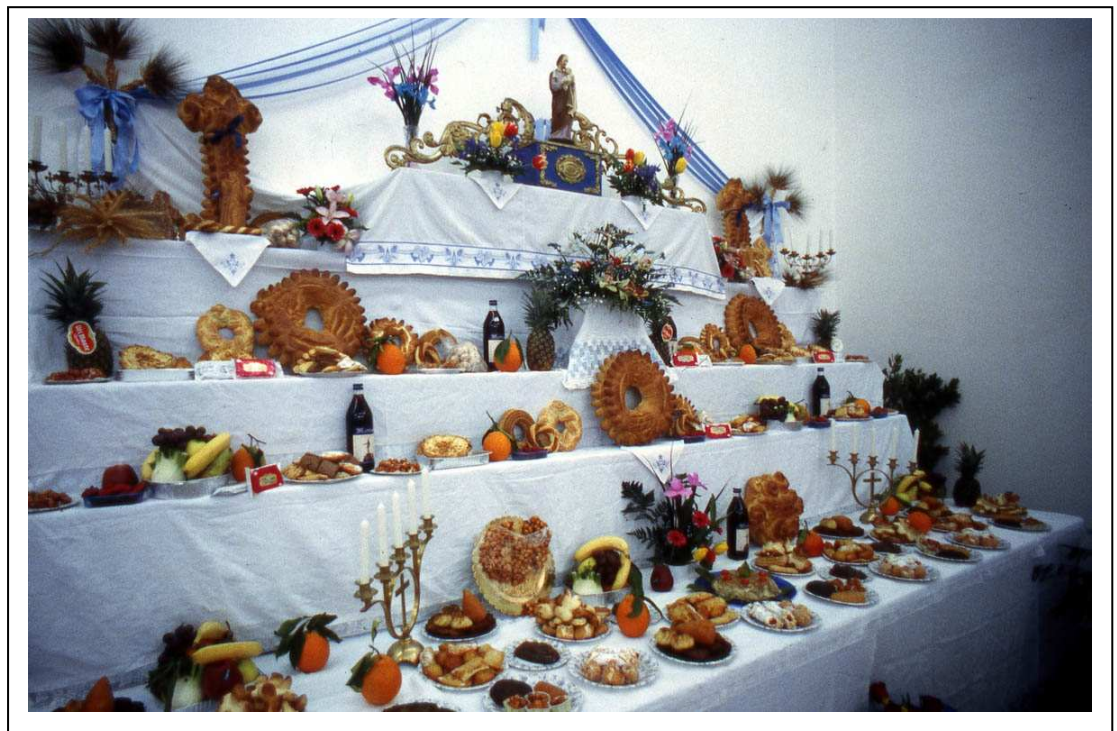
Giarratana RG, altare di S.Giuseppe

Nello specifico tale banchetto – o altare, o cena, o tavolata – è una costruzione formata da una grande tavola ed un altare realizzato con assi di legno a più ripiani, solitamente tre o cinque. Il tutto viene coperto da tovaglie di lino, quasi sempre riccamente ricamate.