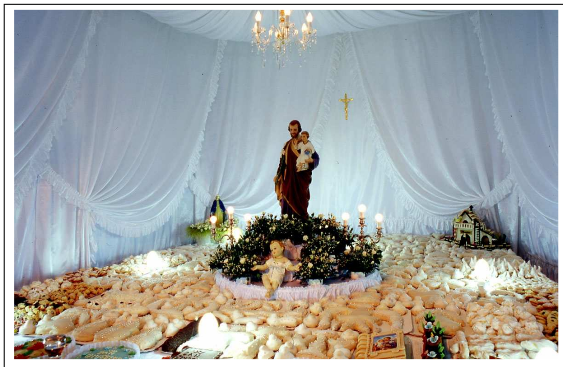
Niscemi CL, altare di S.Giuseppe

In Sicilia San Giuseppe è un santo molto venerato: 15 comuni, tra i 390 dell'isola, lo hanno eletto a loro principale patrono (ma circa 150 lo festeggiano).