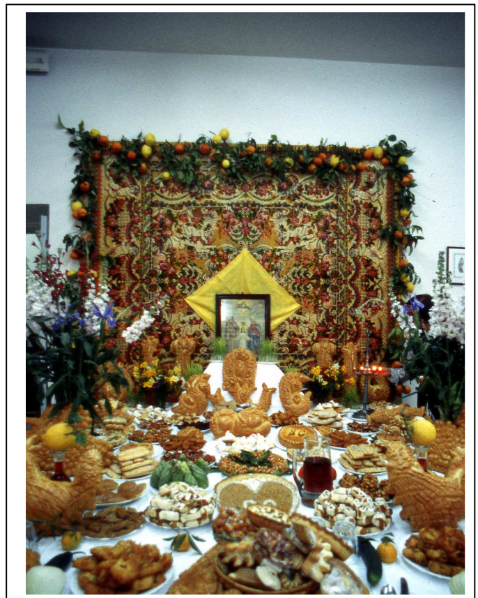
Santa Croce Camerina RG