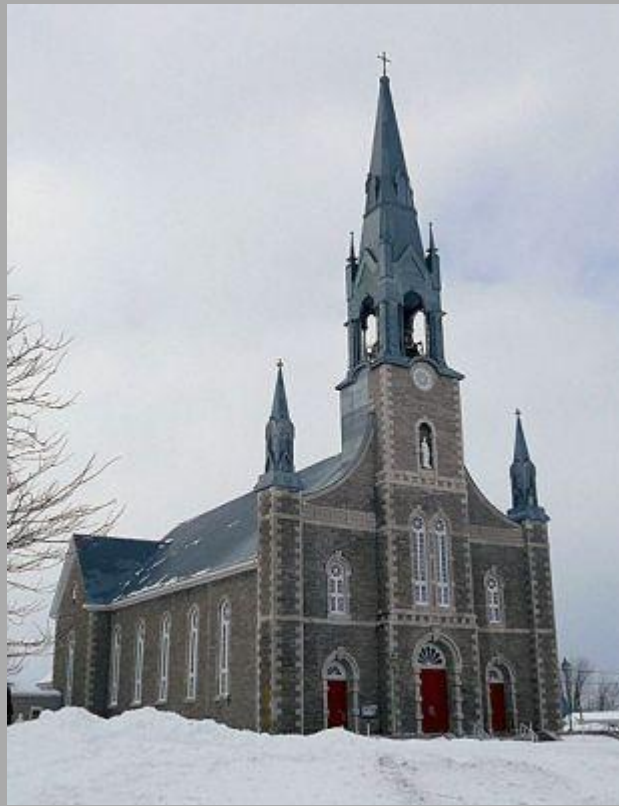
L'église St-Joseph à Maskinongé subira une cure de jeunesse, tout en gardant son cachet.

Lu dans L'Echo de Maskinongé du 19 décembre 2011