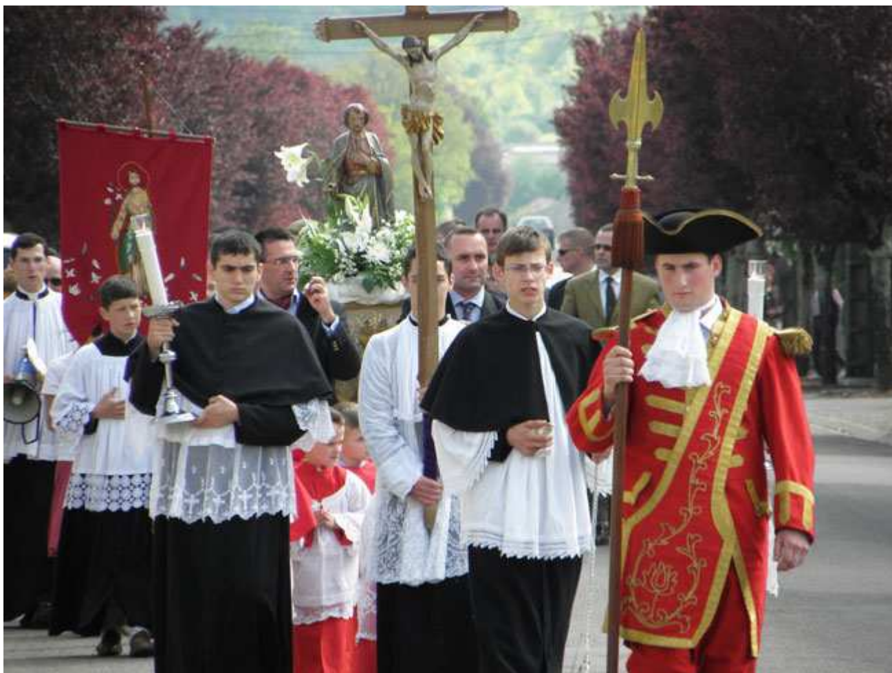
La magnifique procession en l'honneur de saint Joseph

Nous publierons dans quelques semaines une autre chronique de M. l'abbé Challan-Belval entièrement consacrée à l'historique de la « ceinture de saint Joseph », objet de la dévotion de cette procession.